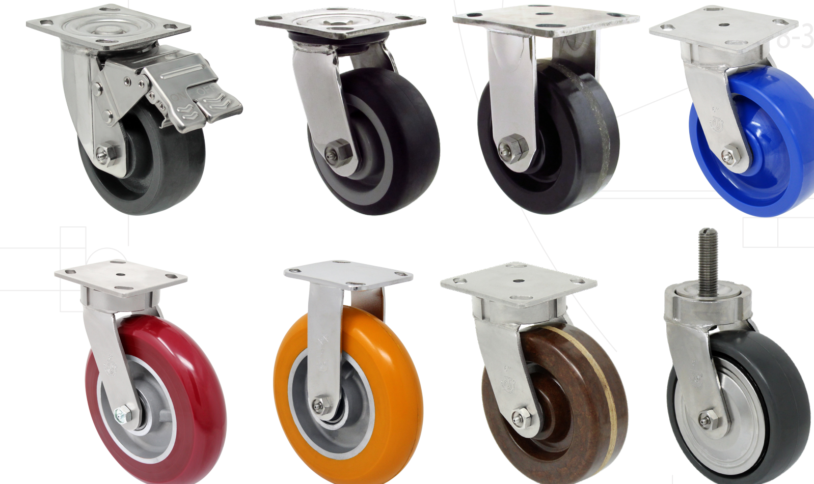
Pisada de 2" en Acero Inoxidable - Trabajo Medio a Pesado