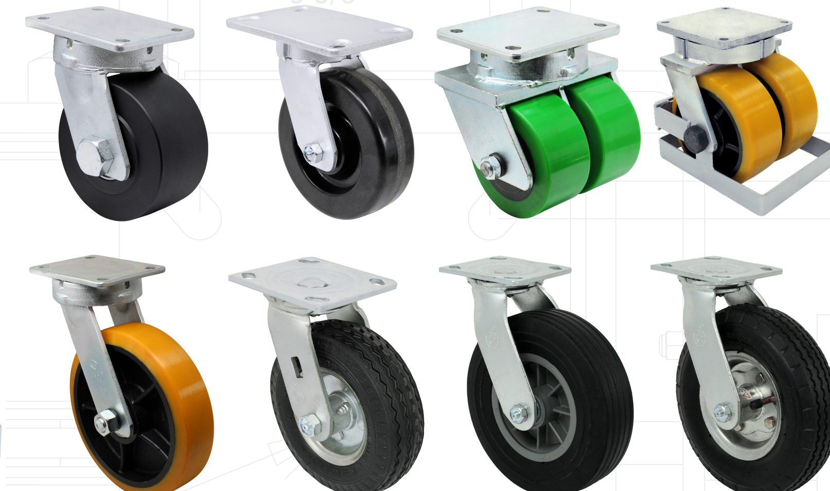
Pisada de 3" - 4" - Trabajo Pesado