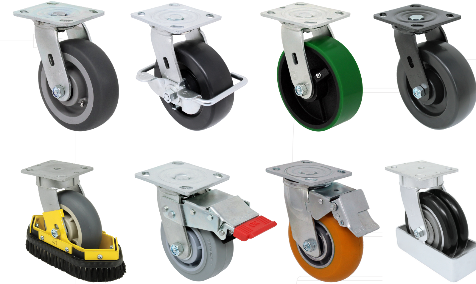
Pisada de 2" - Trabajo Medio a Pesado