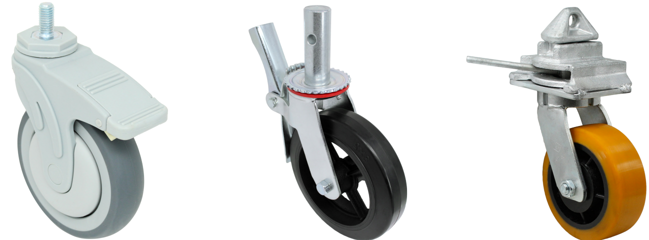
Médico Andamios Contenedor