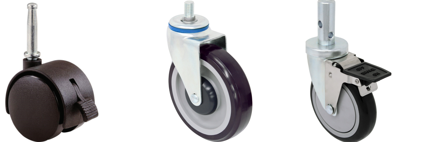
Rueda Gemela Autoservicio Carretilla de mano