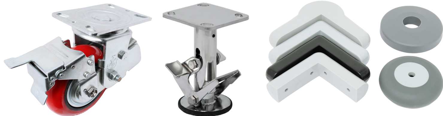
Amortiguación Frenos de Piso Esquineros