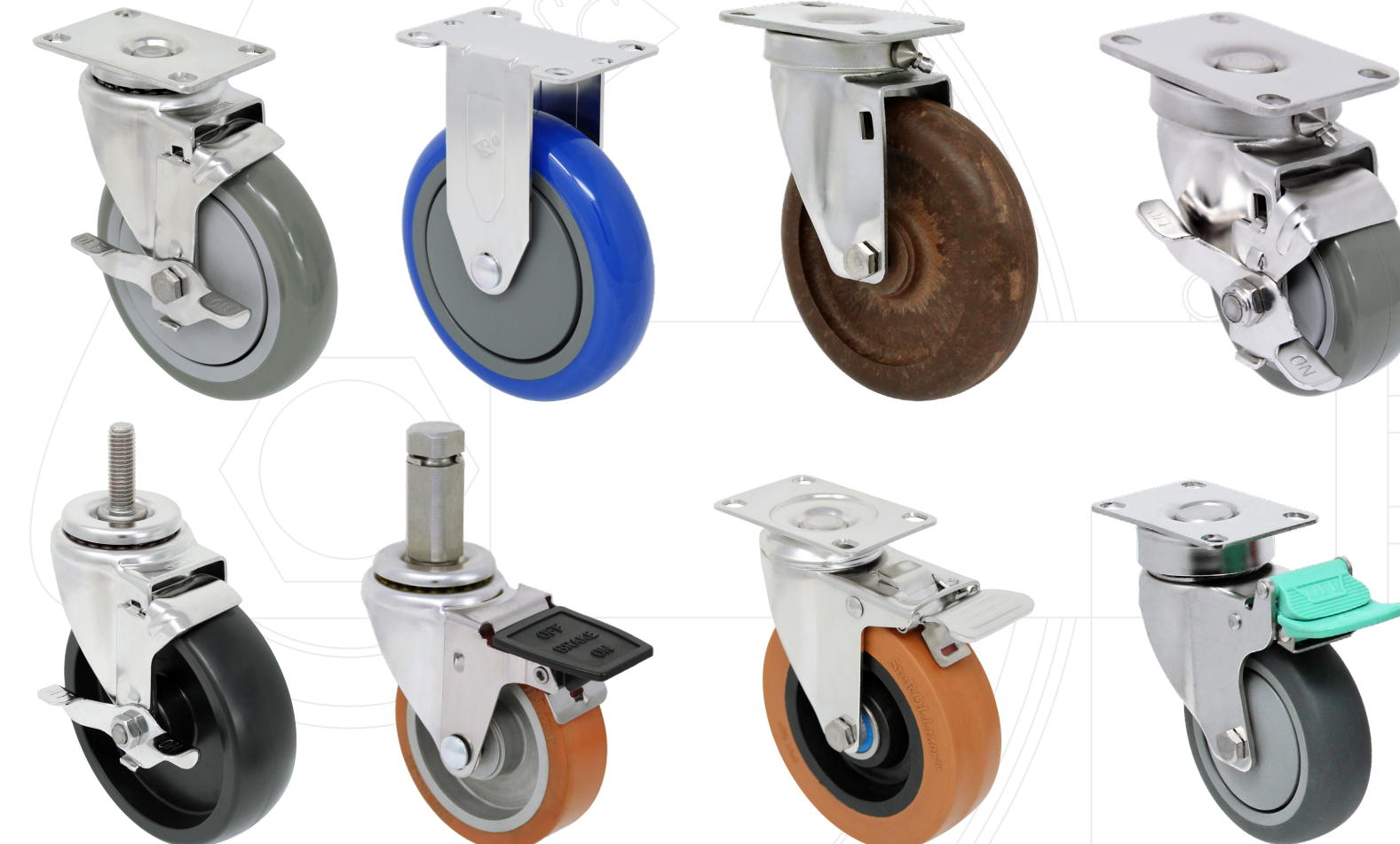
Pisada de 1-1/4" en Acero Inoxidable - Trabajo Ligero a Medio