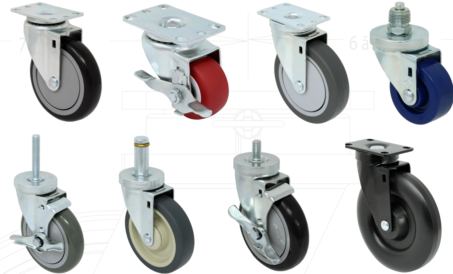
Pisada de 1-1/4" - Trabajo Ligero a Medio