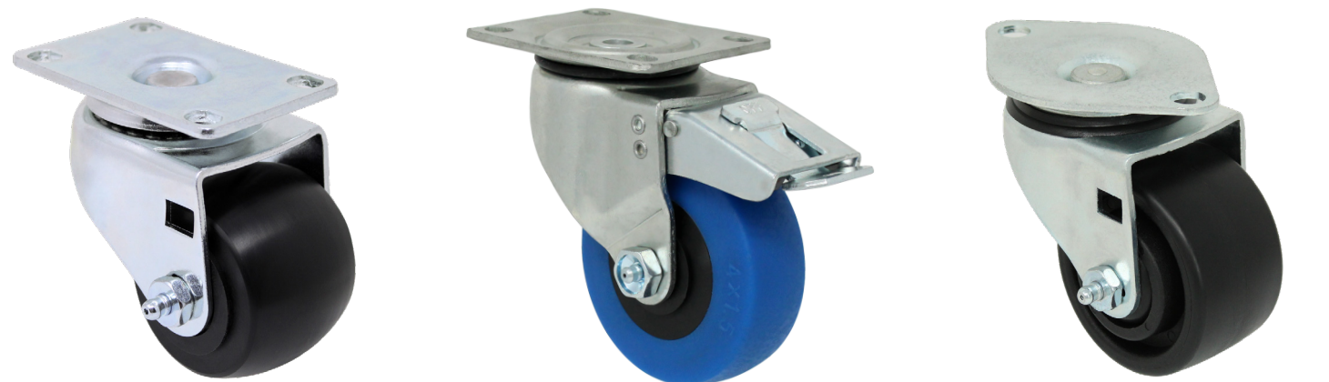
Perfil Bajo Estuche/Rack para Equipo de Audio Rodaja de Carga