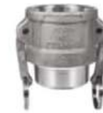
Puente de aluminio