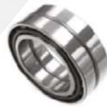
Doble contacto angular