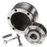
Frenos de contravuelta