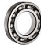
Rígidos de bolas