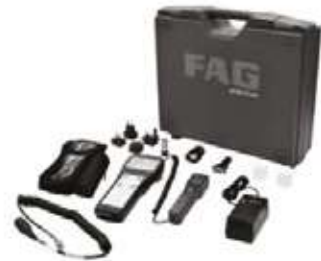
Detector III Monitoreo de vibraciones