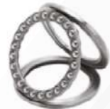
Axiales a bolas de empuje

Rodamientos rígidos de bolas, contacto angular, axiales de bolas, sellados, abiertos, ranurados, de alta velocidad, rodillos cilíndricos, rodillos esféricos, doble hilera de rodillos, cónicos, cono y taza, de agujas, miniatura, seguidores de levas, de super precisión, manguitos de fijación, dobles para la industria automotriz, agrícolas, para rastra, rodamientos especiales, coronas de orientación