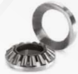
Oscilantes de rodillos