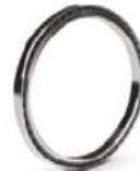
Cuatro puntos de contacto