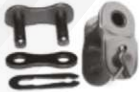
Candados y medios candados