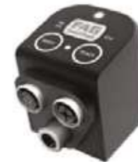
Smart-Check Monitoreo en línea