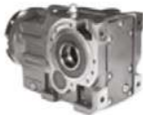
Bisel ángulo recto