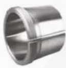
Manguito de desmontaje