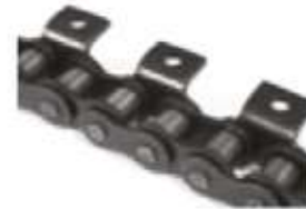
Candados con aditamentos