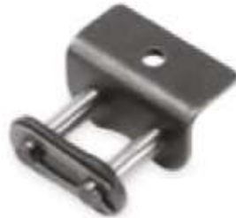
Candados con aditamentos