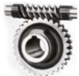
Kits de reparación