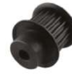
Polea de tiempo