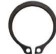
Seguros para flecha o caja