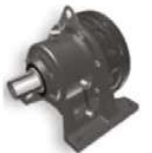
Reductores de velocidad en línea