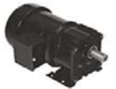
AC gear motors