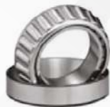
Cono y taza