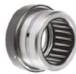
Agujas y axiales de bola