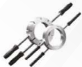
Anillo de Calefacción

Calentadores de inducción, aros calentadores, bobinas inductivas, sets de herramientas de montaje mecánico y de llave de doble gancho, extractores mecánicos, extractores, tuercas y bombas hidráulicas, galgas, equipos de alineación de ejes, poleas y tensión de bandas, detector III, Easy Check, Easy Check Online, Detect XI, Vibro Check.