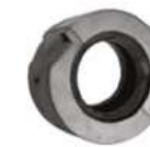
Cubierta para cople