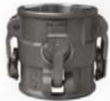
Puente de propileno