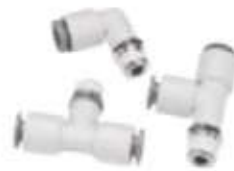
Push in to threaded