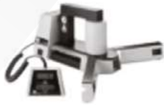
Calentadores por inducción