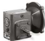
Engranaje ángulo recto