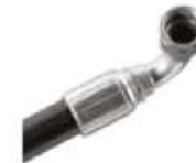
Ensamblados de mangueras