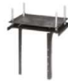
Accesorios para montaje