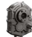
Reductor montado en flecha