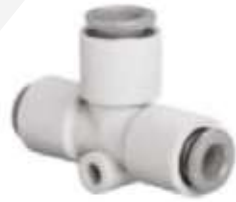
Push in to push in