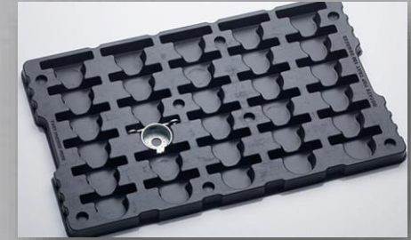
CHAROLAS FABRICADAS EN HIPS ,PET PARA TRASLADO DE SENSORES ELECTRONICOS O PLASTICOS ( CONECTORES )