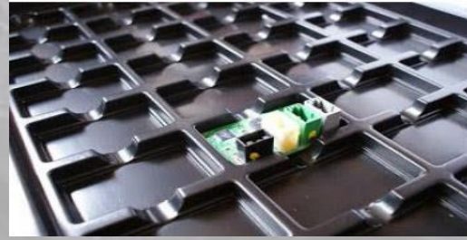
CHAROLAS PARA MODULOS DE COMPONENTES ELECTRONICOS PARA TABLEROS DEL AREA AUTOMOTRIZ