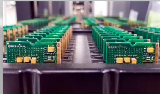
CHAROLAS PARA TARGETAS ELECTRONICAS FABRICADAS CON MATERIALES ESD HIPS. CONDUCTIVO ( 1x10"3 A 1x10"5 OHMS/SCUARE )