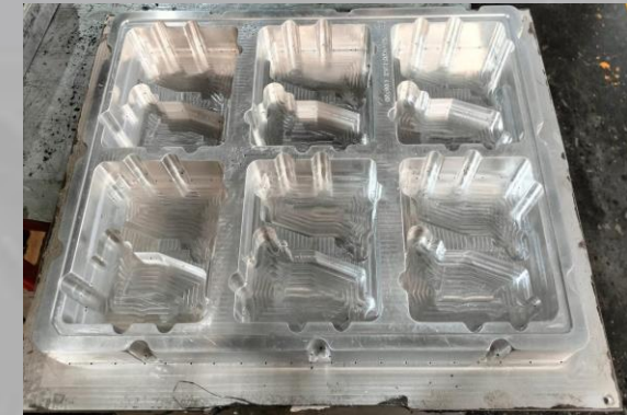
FABRICACION DE MOLDES