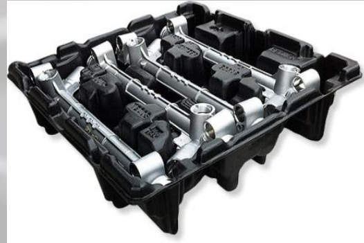
CONTENEDORES PLASTICOS FABRICADOS EN HDPE,HIPS,PP PARA PIEZAS METALICAS