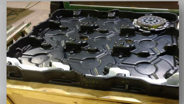
CAHROLAS TIPO TARIMA PARA TRASLADO Y ALMACENAMIENTO DE PARTES METALICAS PARA SUB-ENSAMBLES , FABRICADAS EN DIFERENTES MATERIALES ,. HIPS,HDPE, PET, PP