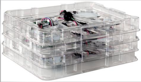
CHAROLAS PARA TRASPORTE DE COMPONENTES ELECTRONICOS FABRICADAS CON MATERIALES ESD HIPS , PET (1x10"6 A 1x10"9 OHMS/SCUARE )