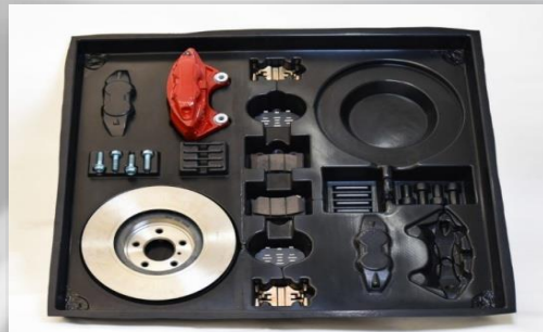
CHAROLAS PARA KIT DE COMPONENTES PARA ENSABLES DE MOTORES. MATERIAL: HDPE