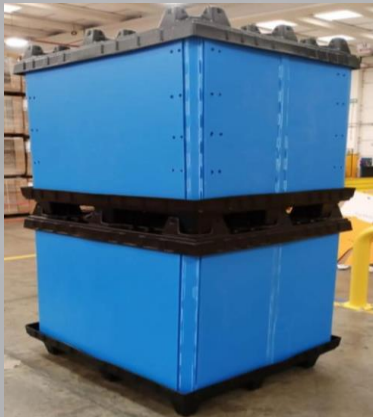
FABRICACION DE TOTES CON O SIN TAPA DE COROPLAS ESD