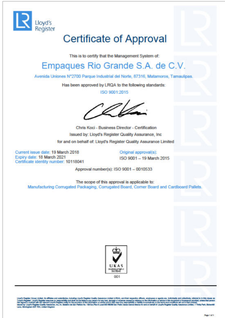
Certificación ISO 9001:2015